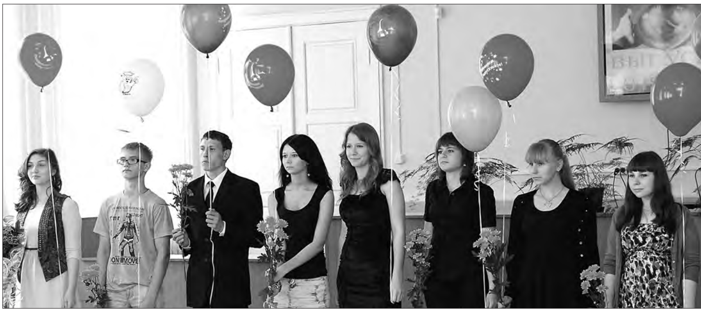
Сегодня у ребят - первый выпускной.