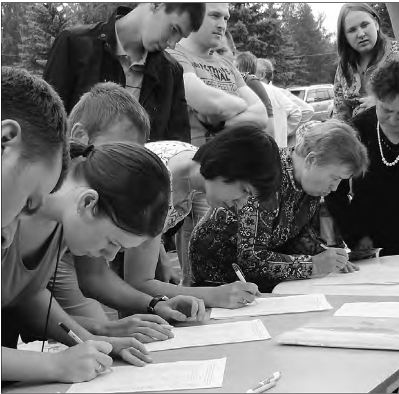
Сбор подписей в защиту Юрьева Камня.