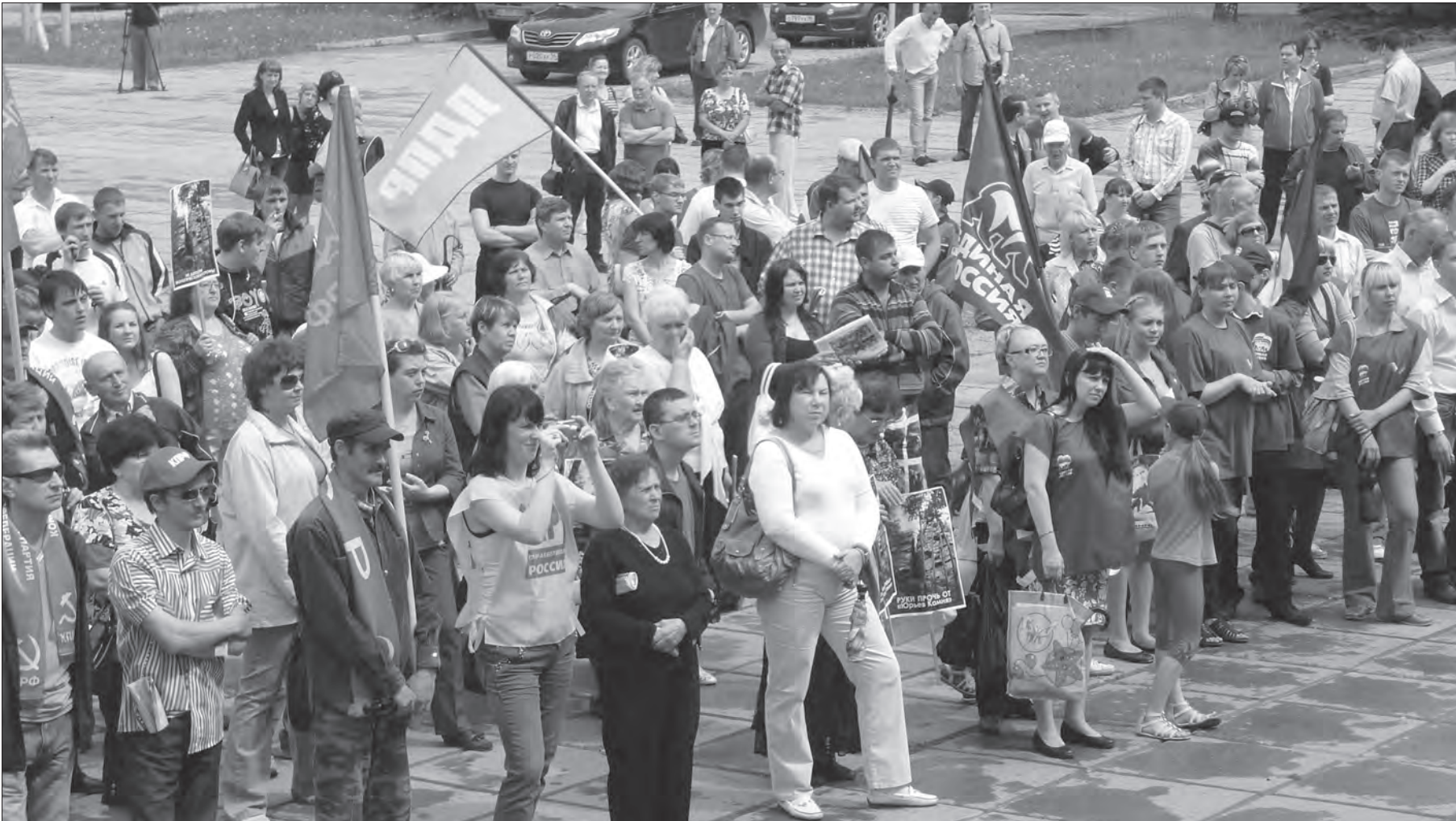
На митинге собралось несколько сотен человек.

Митинг в защиту Юрьева Камня состоялся в минувшую субботу утром в поселке Черноисточинск, а затем в городе возле КДК «Современник».