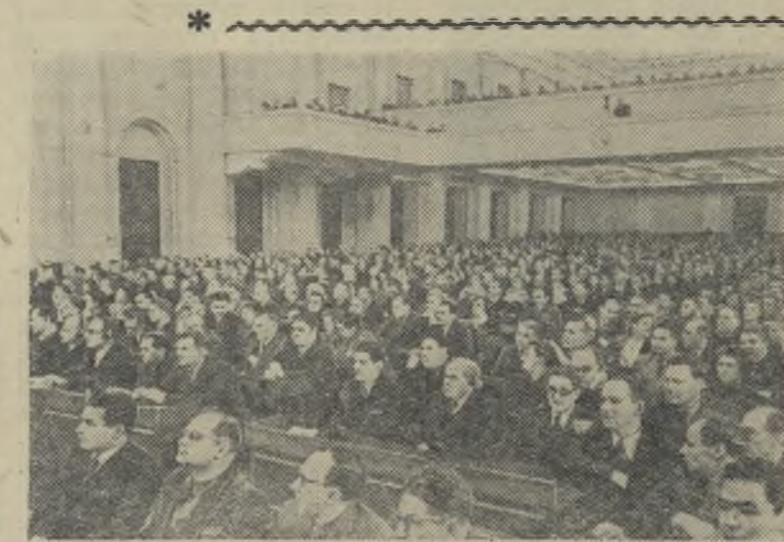
На снимке: В зале заседаний Большого Кремлевского дворца во время Всесоюзного съезда советских художников.

Приняты решения о всемерном развитии монументальной живописи, которая должна украсить общественные здания, клубы, дворцы культуры; о создании высокохудожественной скульптуры — от величественных памятников до предметов быта; о необходимости решительно улучшить качество полиграфического воспроизведения графики, о широком развитии эстампа. Особое внимание