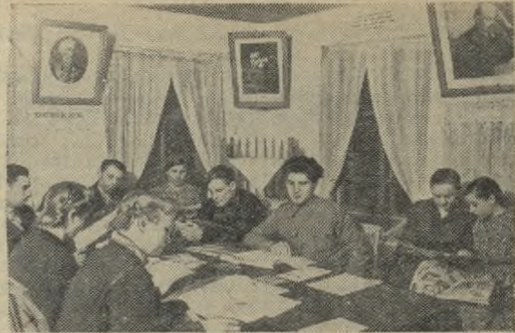
Алтайский край. В колхозе имени Ворошилова Третьяковского района—одном из передовых в крае—имеется хорошая библиотека. В ней свыше 4 тысяч книг. 500 человек постоянно посещают библиотеку. 8 передвижных библиотечек обслуживают бригады и фермы артели.

Когда тов. Калинин долго не выполнял своего обещания устроить буфет, в газете появились сатирические стихи. Помещены стихи и о том, что в здании исполкома грязно, иногда холодно. В газету здесь пишут, но плохо то, что она выпускается с перерывами.