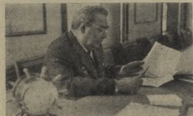
К 75-ЛЕТИЮ ГЕНЕРАЛЬНОГО СЕКРЕТАРЯ ЦК КПСС, ПРЕДСЕДАТЕЛЯ ПРЕЗИДИУМА ВЕРХОВНОГО СОВЕТА СССР Л. И. БРЕЖНЕВА.

На снимке сверху: Генеральный секретарь ЦК КПСС, Председатель Президиума Верховного Совета СССР Леонид Ильич Брежнев в рабочем кабинете.