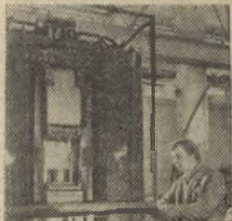
В специальном конструкторском бюро гидромеханической техники Сибирского отделения АН СССР (г. Новосибирск) разработаны бесшумные молоты типов МШ и МВС со встречным ударом.