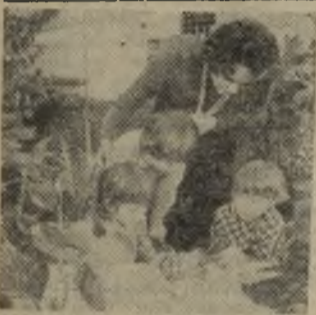
«Лес-сад «Минутка» — один из новых детских учреждений Свердловска. Его посещают 110 детей работников коммунального хозяйства города. Воспитатели организуют с ребятами занятия по русскому языку, учат их рисовать, петь, ухаживать за комнатными растениями.