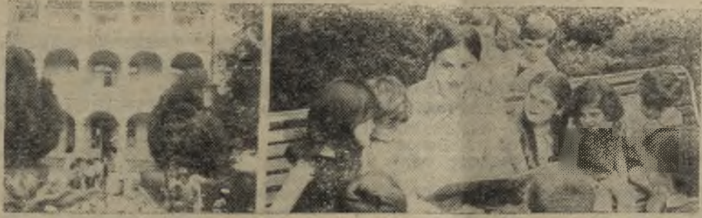
На снимке: в поезде живой природы детского сада.