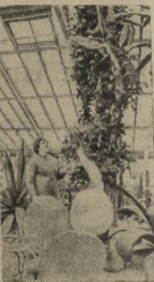
В БОТАНИЧЕСКОМ САДУ

Ленинград. В оранжереях Ботанического сада Академии наук СССР зацвели азалии. Сплошной ковер ярких цветов представляют собою более тысячи собранных под стекляной крышей экземпляров этого дивного кустарника.