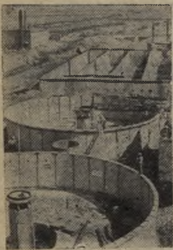
«Обеспечить дальнейшее развитие Саянского территориально-производственного комплекса».

(Из «Основных направлений экономического и социального развития СССР на 1981—1985 годы и на период до 1990 года».)