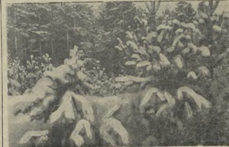
Много снега выпало нынче на Урале. На снимке: в лесу зимой.